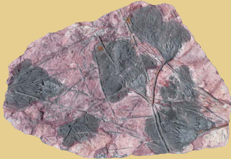
Plaque de fossiles d'encrines provenant d'ERFOUD au Maroc et exposée sur le site Sion ; encrines datant du dévonien (- 400 millions d'années) et présentant l'intégralité du corps : bras, calice et tige.